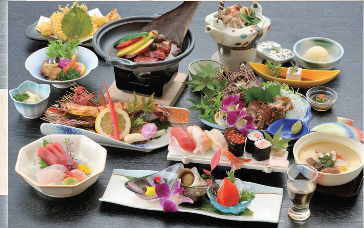
写真はご予算8,000円のお祝い会席