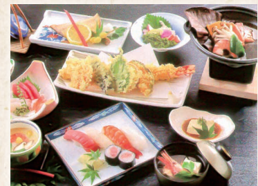
写真はご予算6,000円の大海老の天麩羅入り会席

※季節・仕入れの状況等によりお料理の内容が異なる場合がございます。 ※お客様のご予算・ご要望にお応えいたしますのでお気軽にご相談ください。 ※表示金額は税抜き価格になります。