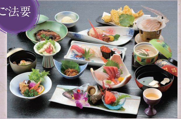
ご法要会席 写真はご予算7,000円のご法要会席